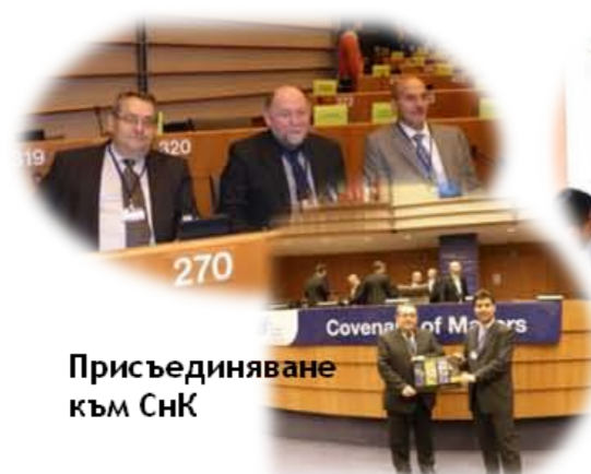
Присъединяване към СнК