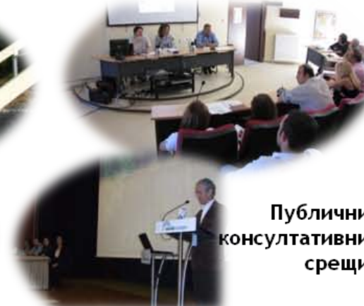
Публични консултативни срещи