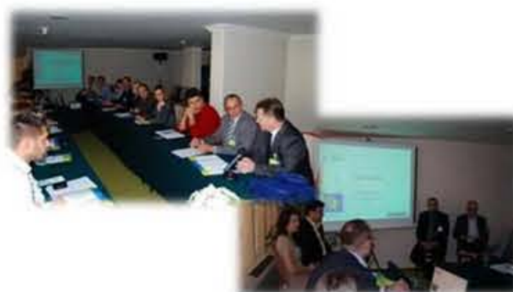
Figura 3. 1ª Sessão de Formação, Cavtat, Croácia

A 1ª formação Erenet foi organizada em simultâneo com o Sustainable Energy Finance and Investment Summit num esforço de aumento de competências de análise dos fundos nacionais e europeus disponíveis.