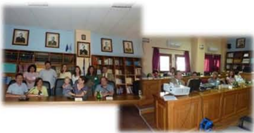
Figura 2. Equipa do eReNet - Kick off Meeting, Amyntaio, Grécia

A reunião inicial de arranque de projecto realizou-se em Amyntaio, Grécia, nos dias 12 e 13 de Setembro de 2011.